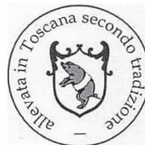
Cinta Senese D.O.P.

Scudo araldico di colore rosso scuro (Terra di Siena - ciano 25%, magenta 89%, giallo 78%, nero 7%) con raffigurazione di Suino in colore grigio scuro con fasciatura sul tronco centrale di colore bianco, il tutto in circonferenza di colore rosso scuro (Terra di Siena - ciano 25%, magenta 89%, giallo 78%, nero 7%). Il carattere tipografico utilizzato per il logo-tipo «Cinta Senese D.O.P. allevata in Toscana secondo tradizione» è il Book Antiqua. La scritta «allevata in Toscana secondo tradizione» deve essere di dimensioni inferiori 2 pt rispetto alla scritta «Cinta Senese D.O.P.». Il logo può essere eseguito con i medesimi caratteri in versione bianco/nero su supporti di materiali diversi, ingrandito o rimpicciolito purché rispetti le proporzioni e disposizione del testo.